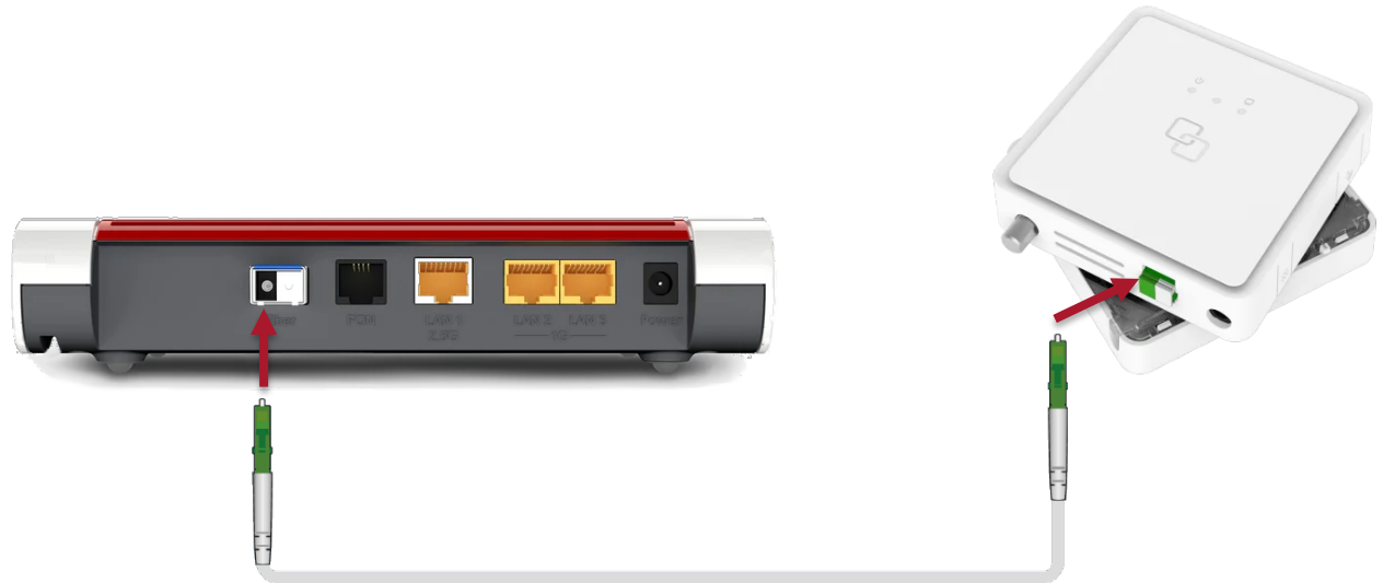
Abb. 3: FRITZ!Box per Glasfaserkabel mit dem Fiber-Twist F2125 verbinden

Einrichtung Ihrer FRITZ!Box an einem Anschluss mit ONT