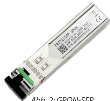
Abb. 2: GPON-SFP