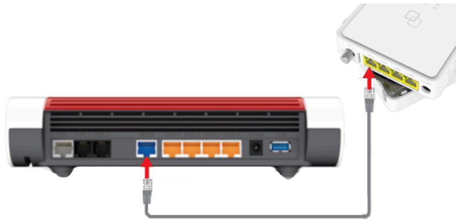
Abb. 1: FRITZ!Box per LAN-Kabel mit dem ONT verbinden

HINWEIS: Wenn Sie die FRITZ!Box bereits an das Stromnetz angeschlossen haben, trennen Sie das Netzkabel und stecken Sie es wieder ein, um die FRITZ!Box neu zu starten.